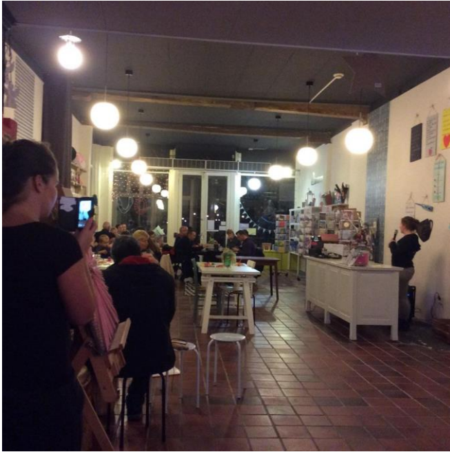
Gemaakt tijdens het kerstdiner.